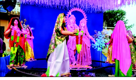
সুরম হার কাকীপ গৌড়ী মঠের রাসভা। এটি কাকীপ মহকুমার প্রাচীন রাস উৎসব। প্রতিষ্ঠাতা ভক্তিবিশ্ব মঙ্গলমহাশয়। বিস্মিত হই স্বয়ং করায়ো রজন বঙ্গ ভিত্তি। দলোপায়াগী সাতদিন পূর্ত্য।

কম্প্রেশনের সাথে মিশ্রিত করে এবং আলোকের ক্রমাগত হ্রাসের হাইড্রেশনের অনুভূতি দেবে এবং ট্রান্স-এপিডার্মাল সিরামের হ্রাস করে যা এটি আপনার চর্মে পরিষ্কার করে এবং স্বাভাবিকভাবেই ত্বককে পুষ্ট করে।